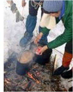
ФОТО СЕССИЯ по пройденному материалу: